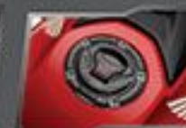
FUEL LID PAD