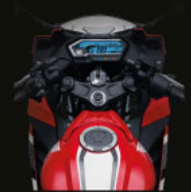
NEW COCKPIT DESIGN

The All New CBR150R hadir dengan generasi baru desain dan fitur motor sport yang mampu menghidupkan imajinasi balap setiap rider saat pertama kali melihatnya. Desain depan lebih rendah dan ramping untuk memberikan rider pandangan jelas dan lebih dekat dengan jalanan. Juga didukung dengan sistem pencahayaan LED yang lebih terang dan bentuk yang lebih ramping. Tampilan Cockpit View dengan desain baru Panelmeter yang ramping dilengkapi indikator digital yang mudah terlihat serta Aeroplane Fuel Cap yang menunjang karakter balap makin agresif. Setiap detail dirancang agar lebih ringan dengan massa berpusat di titik sentral. Keseluruhan tampilan baru ini membuat setiap rider dapat merasakan sensasi balap yang mereka inginkan.