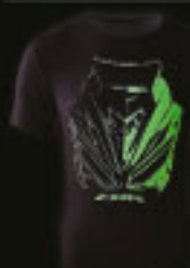
CBR Headlight T-Shirt