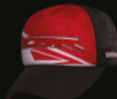
CBR Trucker Caps