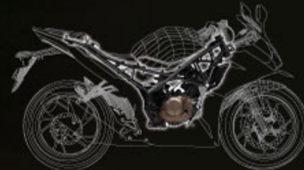
INNOVATIVE TRUSS FRAME WITH NEW ALUMINUM ENGINE HANGER

Honda percaya bahwa motor sport seharusnya mampu bereaksi sesuai dengan setiap gerakan sang rider. Untuk itu, The All New CBR150R menggunakan Truss Diamond Frame yang memberikan rigidity dan fleksibilitas yang seimbang. Serta seat rail dan pivot plate yang dirancang khusus untuk membuat karakter lebih sporty. Bodi motor lebih kompak berkat rear cowl lebih pendek tetapi memiliki swing-arm dan wheelbase lebih panjang serta didukung suspensi Pro-Link untuk stabilitas di segala kecepatan dan kondisi jalan. Posisi stang kemudi lebih rendah dan menekuk ke dalam membuat posisi berkendara makin bergaya racing dan dinamis. Semua ini memenuhi keinginan setiap rider untuk handling yang sempurna dan stabilitas lebih baik di segala kondisi jalan.