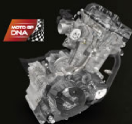
NEW GENERATION DOHC-6 SPEED ENGINE

The All New CBR150R dilengkapi generasi terbaru mesin DOHC-6 kecepatan menghasilkan torsi besar di tarikan awal sampai menengah yang memberikan kontrol power yang lebih baik. Setting khusus di putaran tinggi agar berkendara makin agresif, engine mount dengan sudut 40°, memperbesar diameter throttle body untuk efisiensi intake serta rasio kompresi 11,3. Semua ini memberikan tenaga berlimpah sejak akselerasi awal sampai puncaknya dengan rentang performa yang sangat panjang. Juga dilengkapi teknologi minim gesekan untuk efisiensi bahan bakar lebih baik dan meningkatkan performa mesin. Hasilnya, rider mampu mendapatkan tenaga yang dibutuhkan untuk kendali penuh baik di lintasan balap maupun di jalanan.