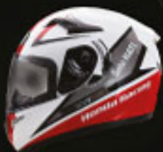
Full Face Helmet