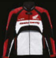
On Road Leather Jacket