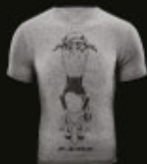
CBR Grey T-Shirt