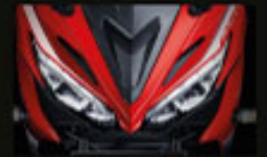
NEW ALL LED LIGHTING SYSTEM